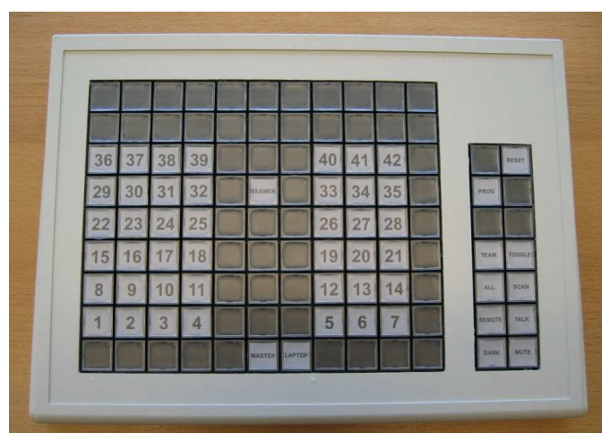
Abb. 2: VL-Tastatur für max. 100 Teilnehmer

Die Basisfunktionen können durch Drücken von ein bzw. zwei Tasten aktiviert werden. Um den Monitorbild des Dozenten-Computer auf die Monitore der Teilnehmer zu senden, drückt der Dozent nur die Taste „ALL“. Alle